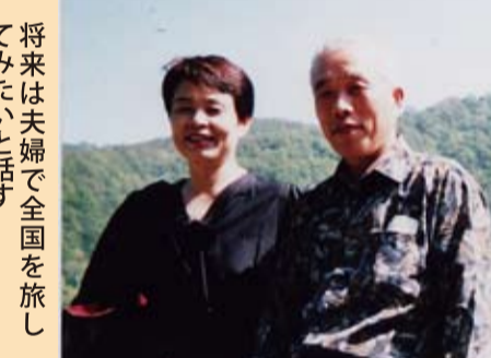
将来は夫婦で全国を旅してみたいと話す

ぎて加入したのですが、年金を受け取るようになった今でも、もっと若いときにこの制度があれば良かったのと思っています。若い世代の人にもぜひお勧めしたいんですが、入っていないのは制度や仕組みを知らないからではないでしょうか。もっと色々な方法でみんなに知らせて行くことが大切だと思います。夫は本当に仕事一筋で趣味らしい趣味もないので、仕事を辞めたらキャンピングカーでも買って全国を回ろうか、などと話しているんです。そのときには年金の有難さが今よりもっと分かるかもしれません。